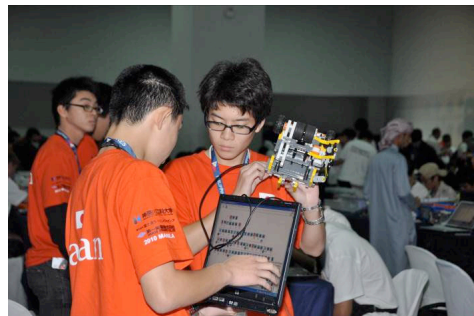
困ったときのチームワーク