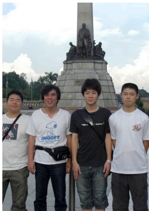
リサール・パーク