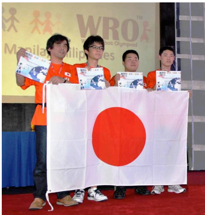
「Certificate of Excellence Award」優秀賞を受賞