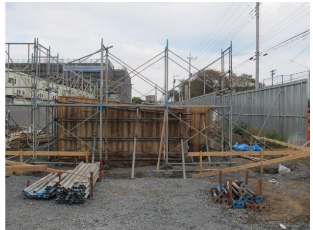
正面左側からの写真