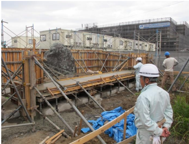
コンクリートを流す作業中